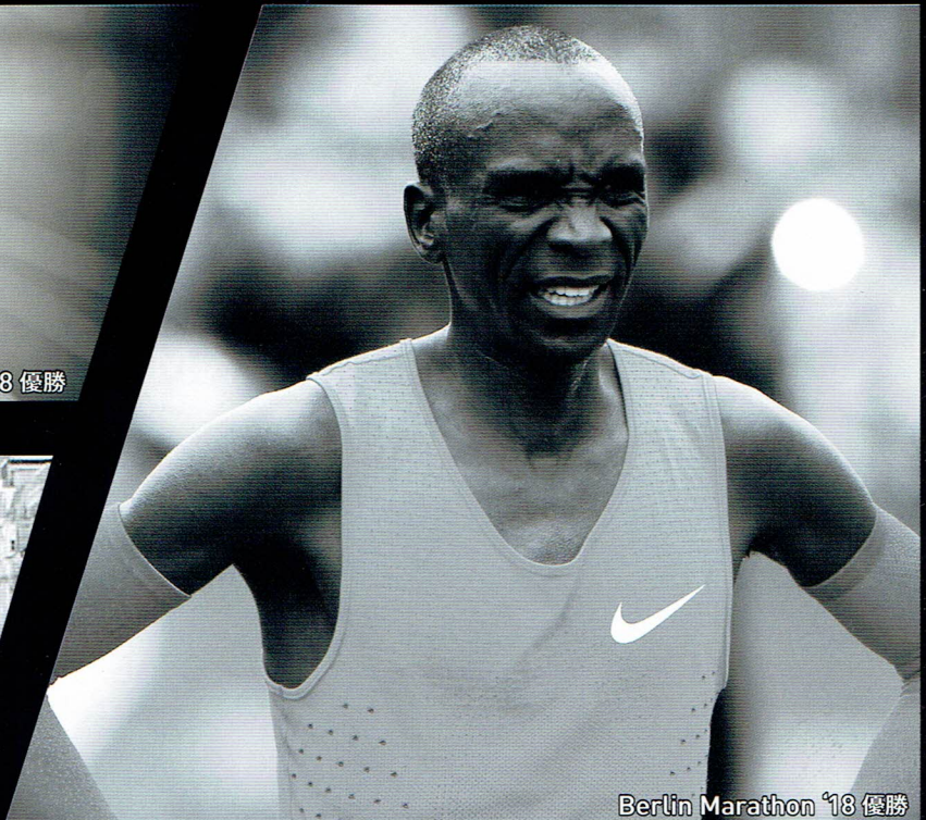
Berlin Marathon '18 優勝